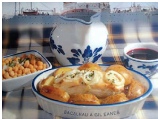
Bacalhau à Gil Eanes