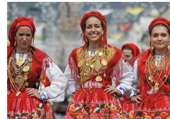
Romarias da N. S a Agonia