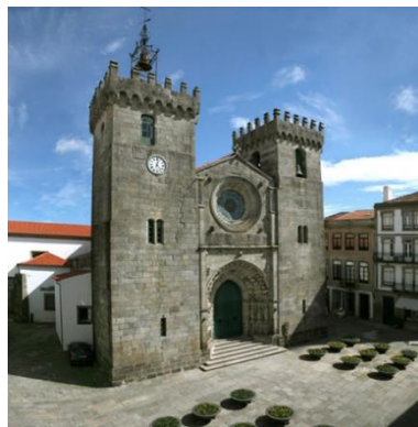
Sé Catedral de Viana do Castelo