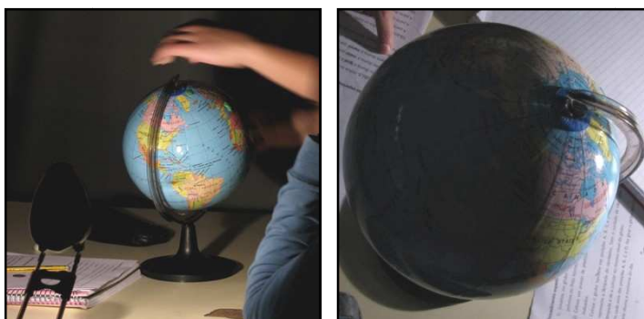
Figuras 4 e 5: Simulação da Terra no Solstício de Junho

Por essa razão, é mais correcta a referência, por exemplo, ao Equinócio de Março do que ao Equinócio da Primavera.