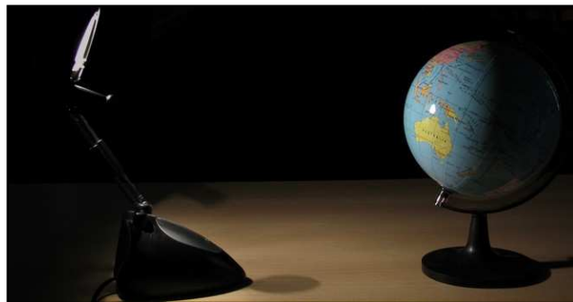
Figura 2: Simulação da Terra no Solstício de Dezembro

A actividade deverá ser realizada numa sala escura para que seja bem visível a fronteira entre as zonas iluminada e não iluminada do globo e, de preferência, sobre uma superfície escura para que a luz não seja reflectida para a parte inferior do globo.