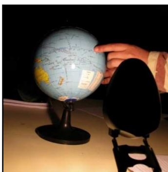
Figura 6: Simulação da Terra no Solstício de Dezembro

O oposto ao descrito ocorre no Solstício de Dezembro.