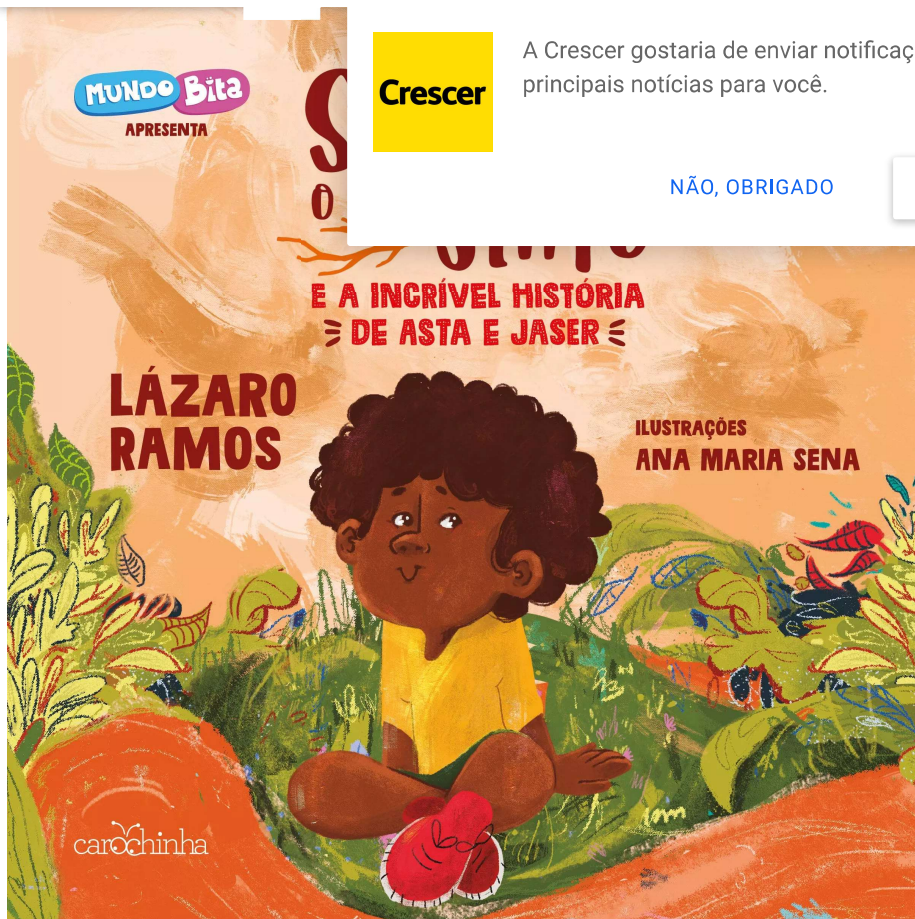
SINTO O QUE SINTO e A INCRÍVEL HISTÓRIA DE ASTA E JASER