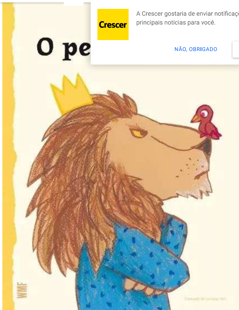
O PEQUENO GUI