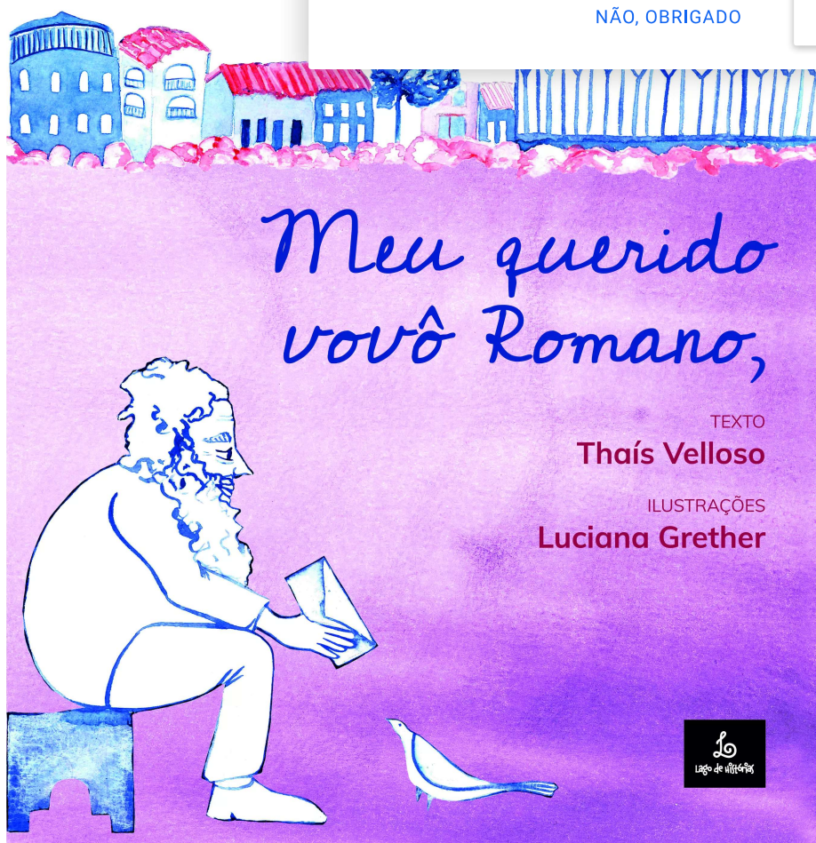
MEU QUERO AVÔ ROMANO