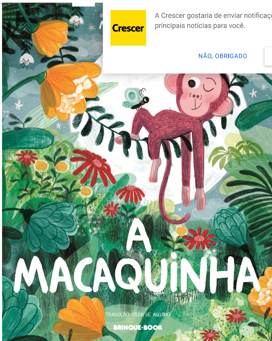
A MACAQUINHA