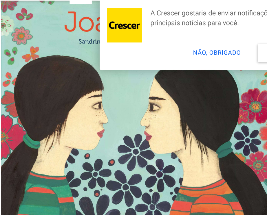
JOANA E LIA